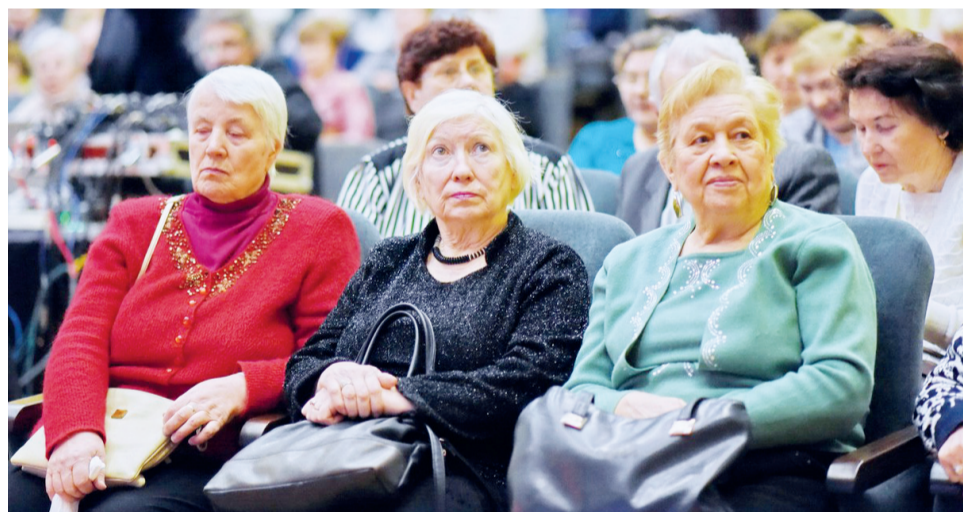
Зрители с нетерпением ждали начала праздничного концерта